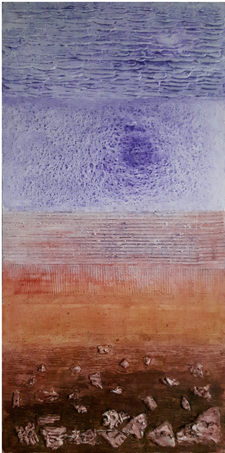
Vortice (2019), tecnica mista su juta, cm 50x100