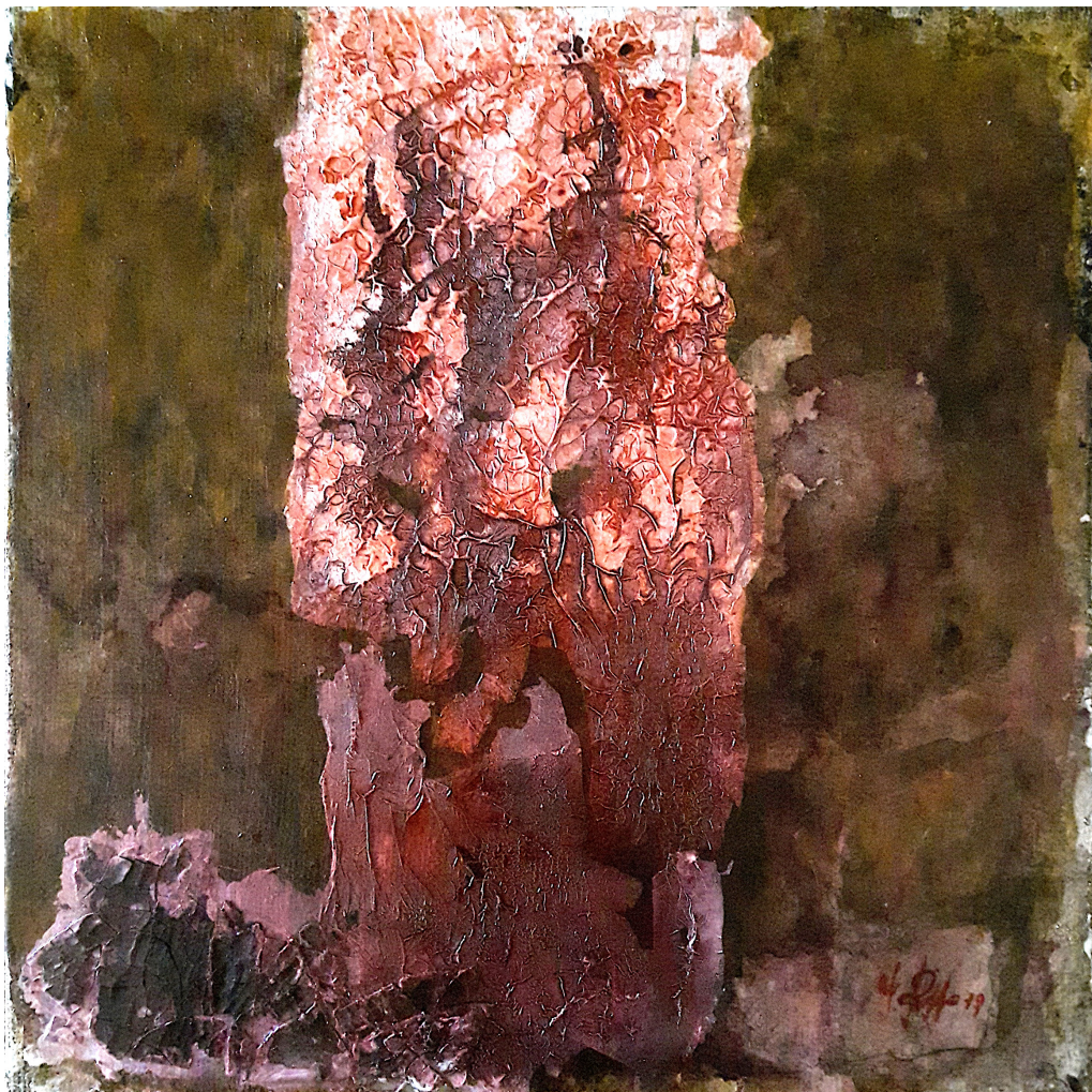
Colonna d'Ercole (2017), tecnica mista su juta, cm 50x50