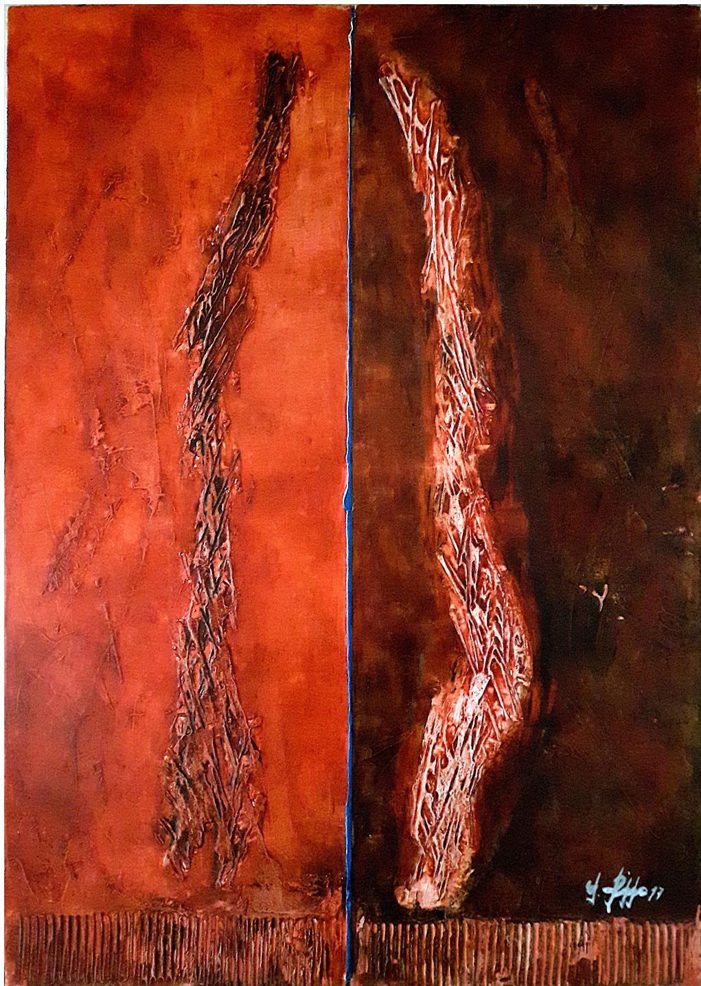
Segnali (2017), tecnica mista su tela, cm 50x70