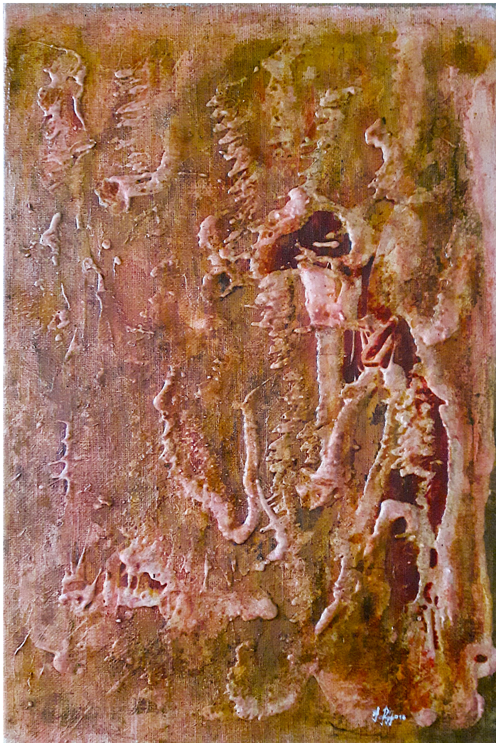
Impronte fossili (2017), tecnica mista su tela, cm 60x90