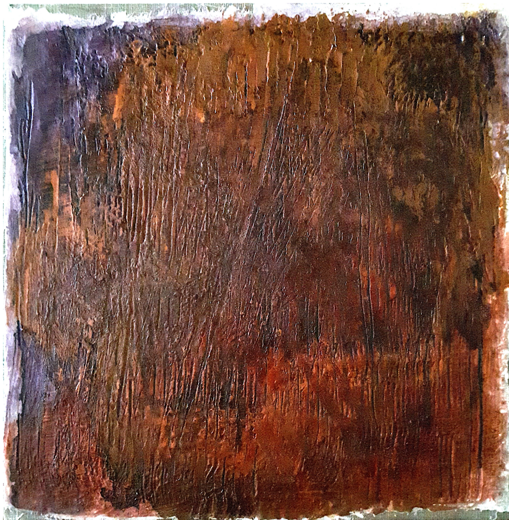
Sovrapposizioni (2017), tecnica mista su juta, cm 50x50