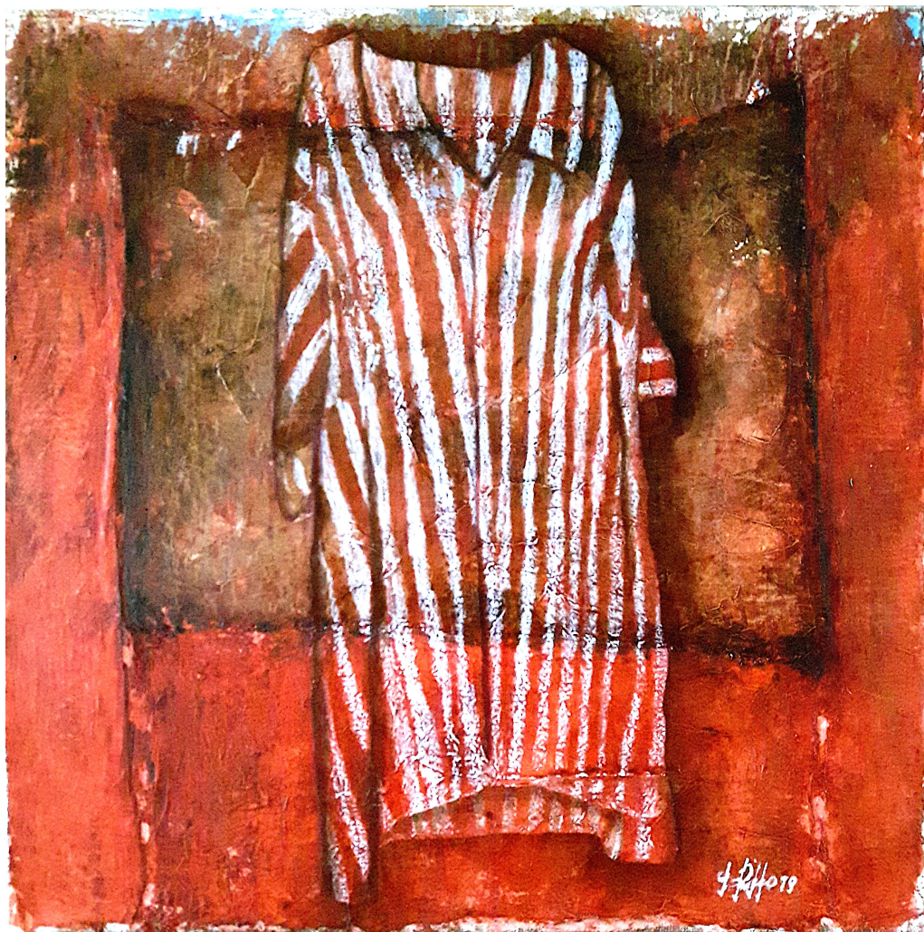
Righe della memoria II (2019), tecnica mista su juta, cm 50x50