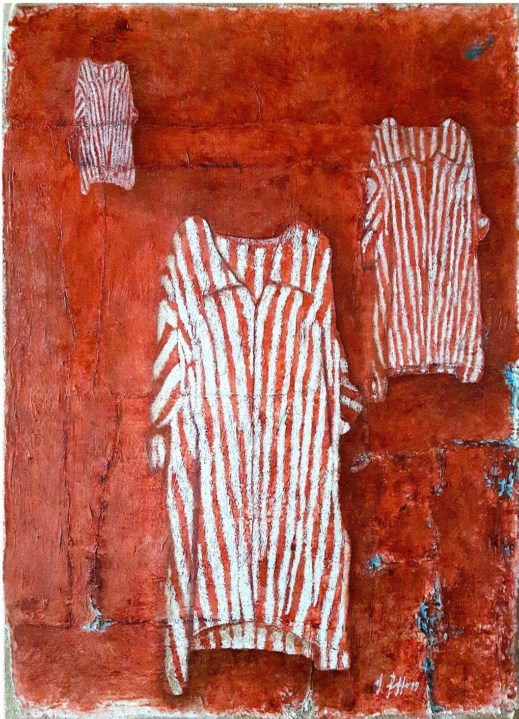
Righe sciolte (2019), tecnica mista su tela, cm 65x90