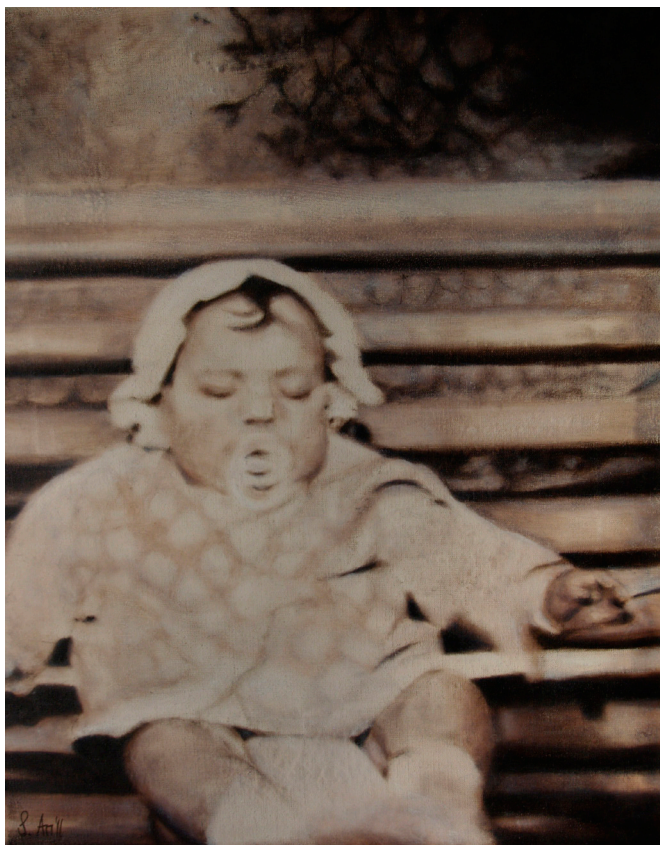
Simone Ari, Ritratto di Adelinda Allegretti (2011), olio su tela, cm 40x50

Nasce a Roma nel 1969 e qui si laurea presso l'Università degli Studi "La Sapienza" in Storia comparata dell'arte dei paesi europei col Prof. Enzo Bilardello, affrontando una tesi di ricerca sul pittore italo-spagnolo Bartolomé Carducho, vissuto in Spagna a cavallo tra il 1500 ed il 1600.