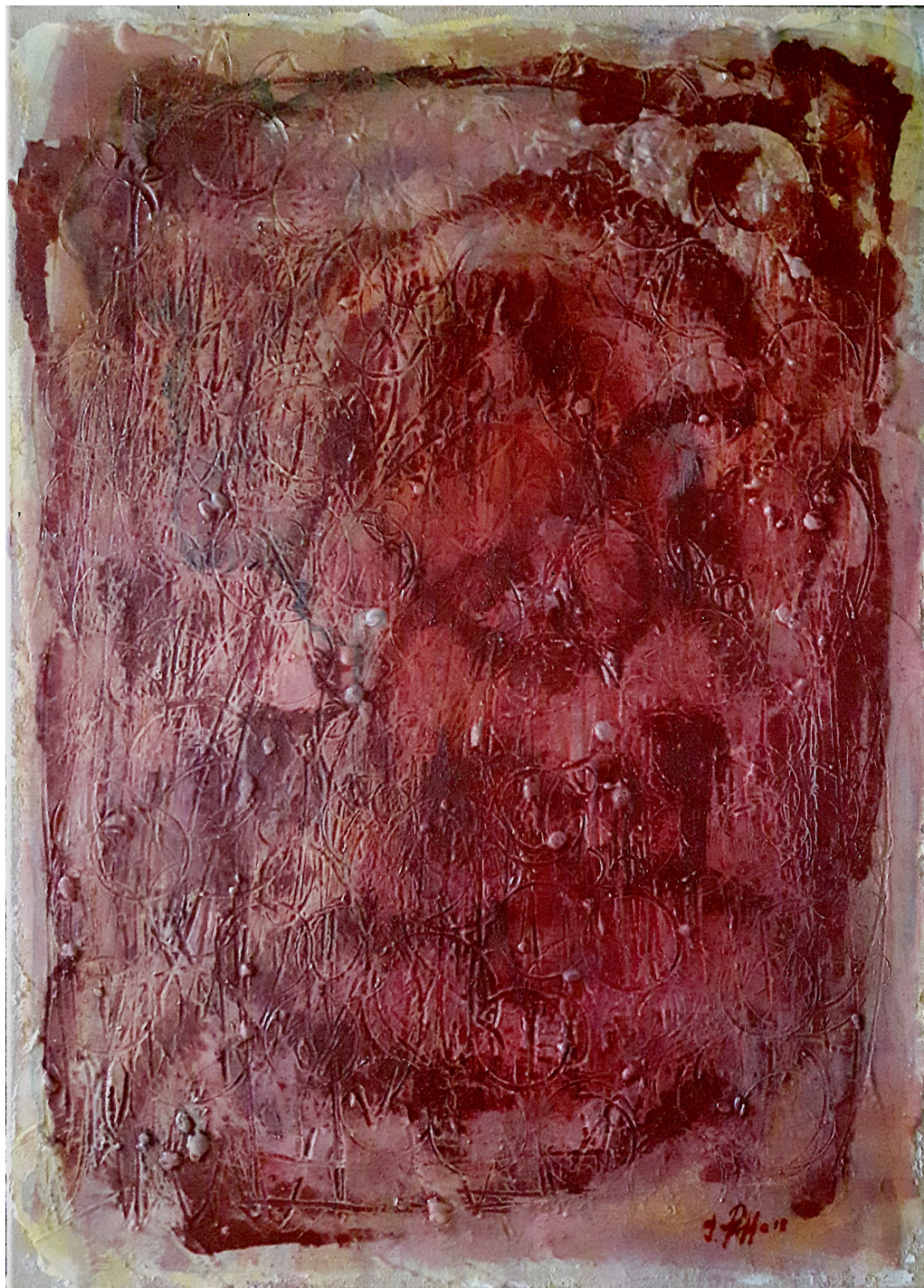
Ritorno alla luce (2018), tecnica mista su tela, cm 65x90