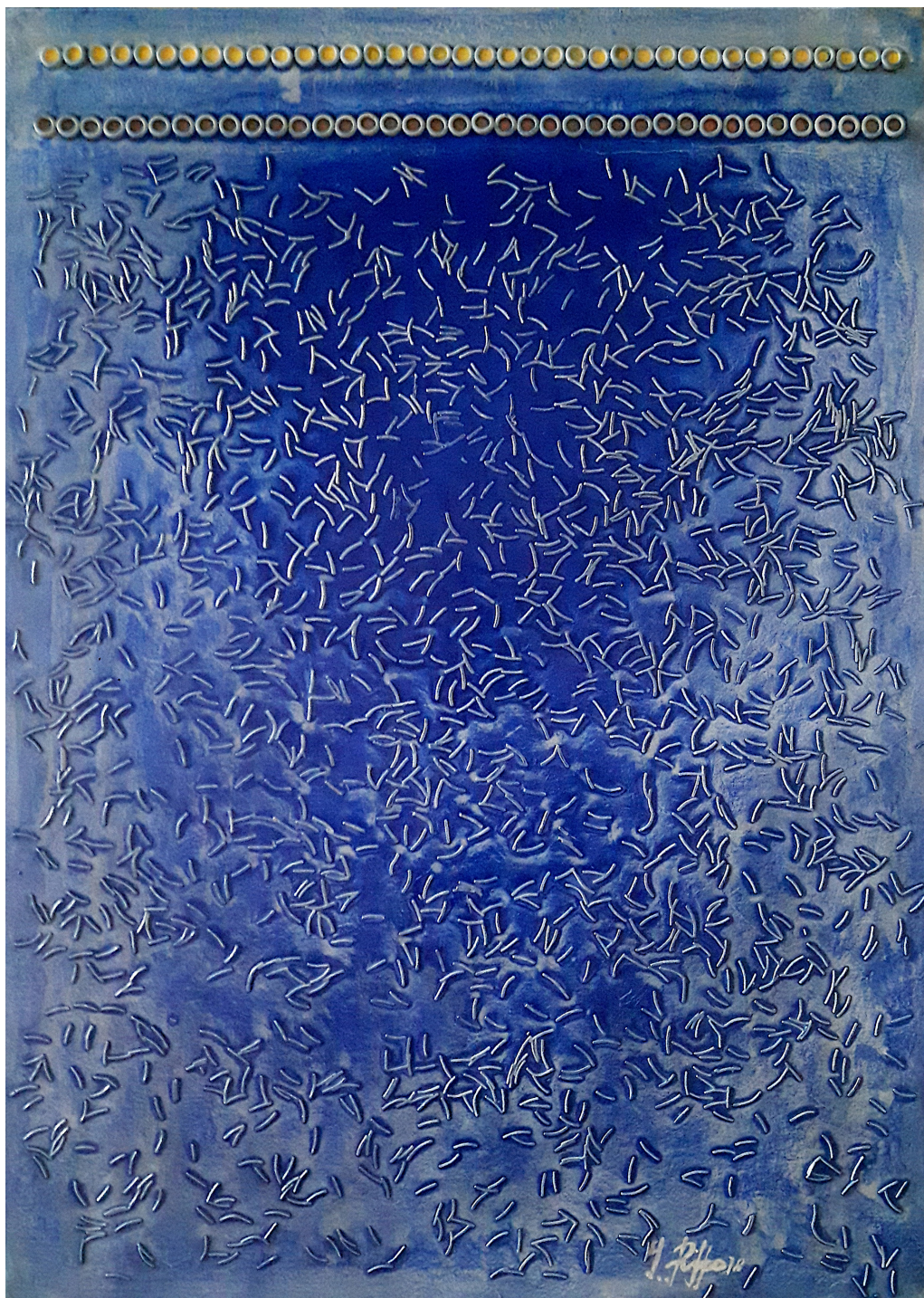
Corsa verso l'infinito (2018), tecnica mista su tela, cm 50x70