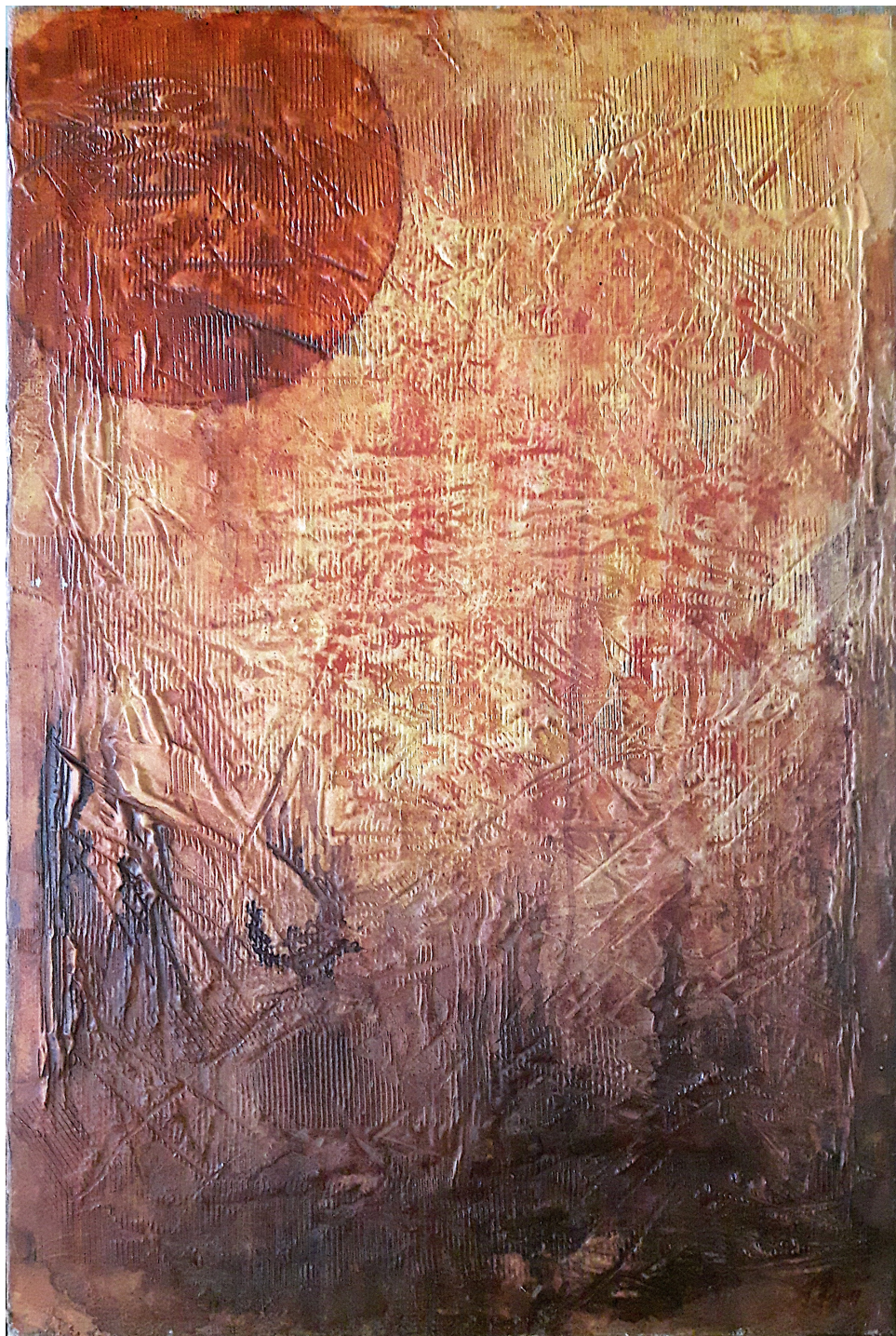
Nana rossa (2017), tecnica mista su tela, cm 60x90