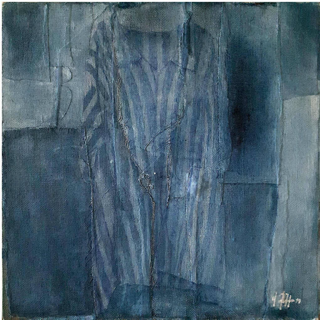
Righe della memoria (2019), tecnica mista su juta, cm 50x50