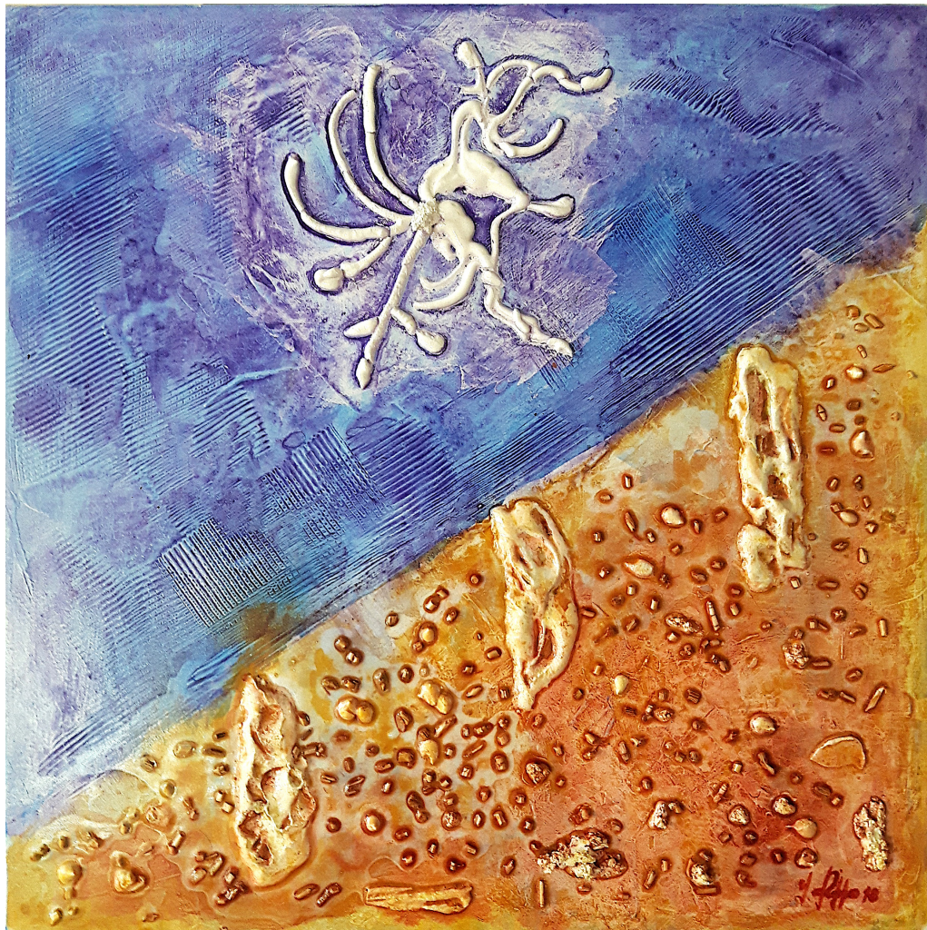
Scilla (2019), tecnica mista su juta, cm 50x50