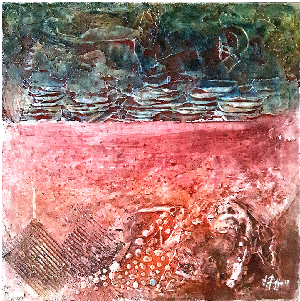
Impronte fossili II (2017), tecnica mista su tela, cm 50x50