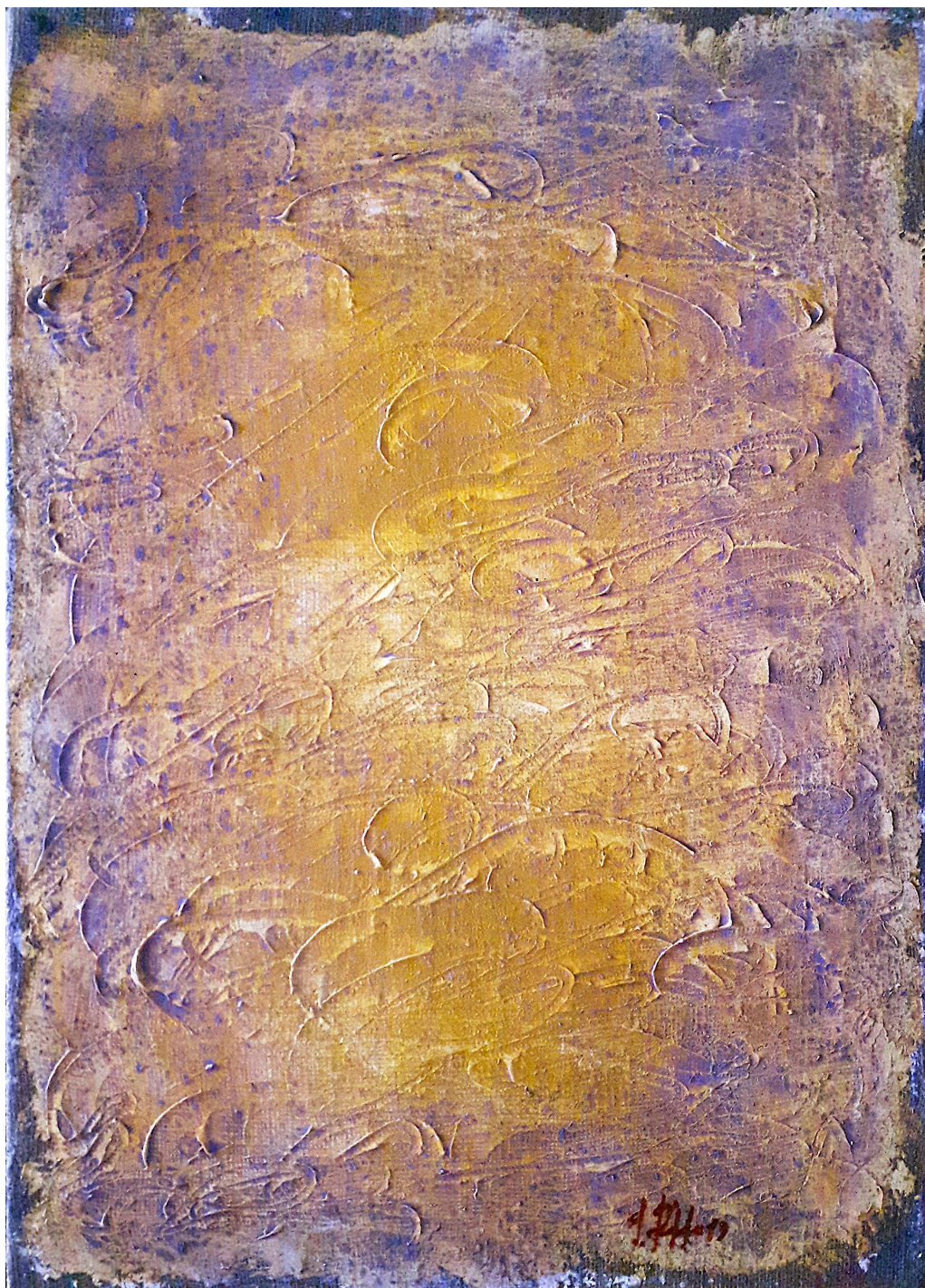
Volute cosmiche (2019), tecnica mista su tela, cm 50x70