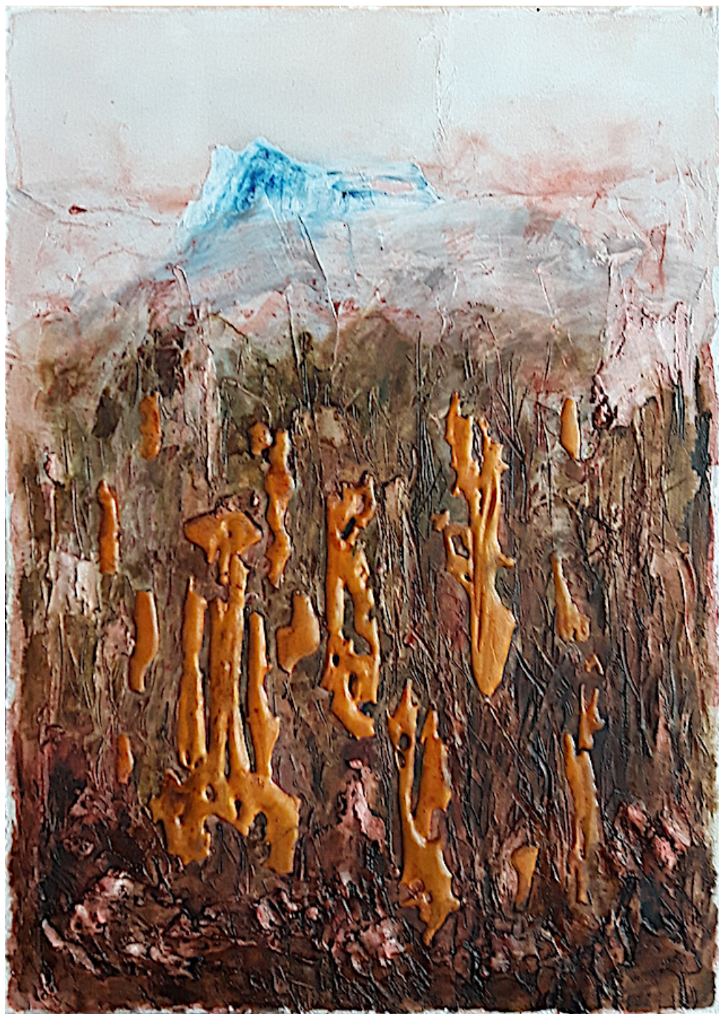
Prospettiva con montagna (2019), tecnica mista su tela, cm 50x70