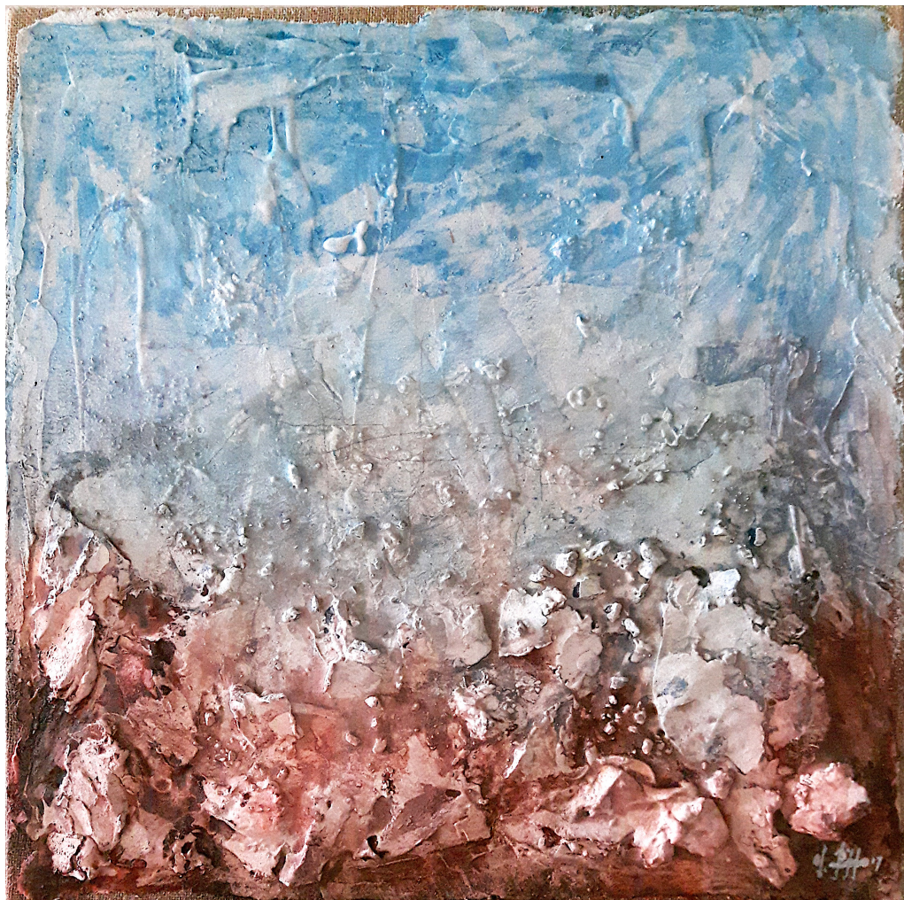
Bassa marea (2017), tecnica mista su juta, cm 50x50