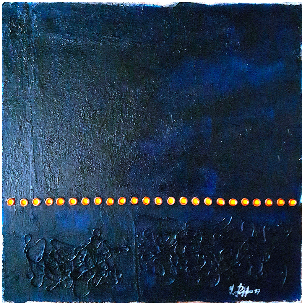
Nel blu (2018), tecnica mista su tela, cm 50x50