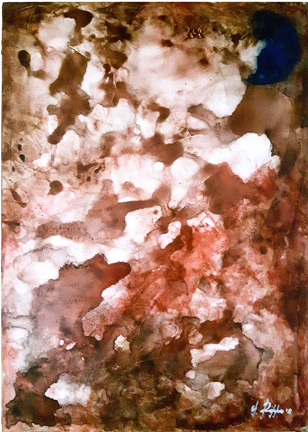
Bolle (2019), tecnica mista su tela, cm 50x70