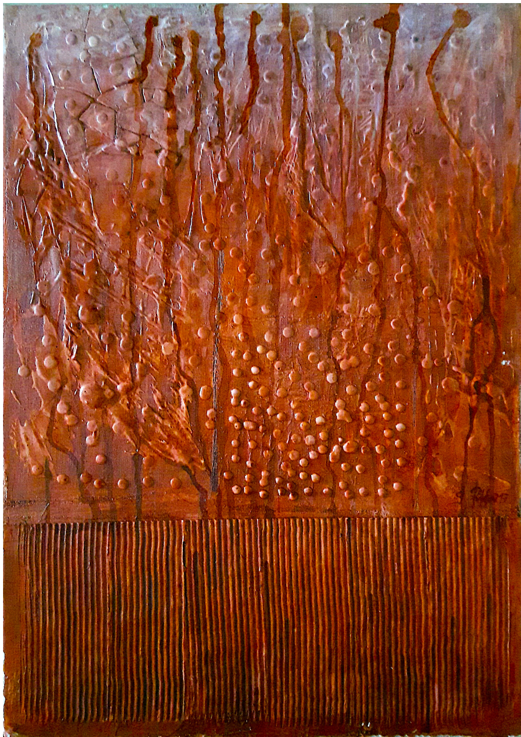
Evaporazioni (2017), tecnica mista su tela, cm 50x70