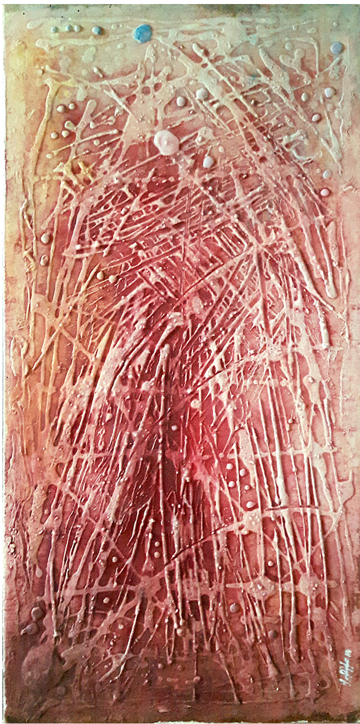
Intrigo (2018), tecnica mista su juta, cm 50x100