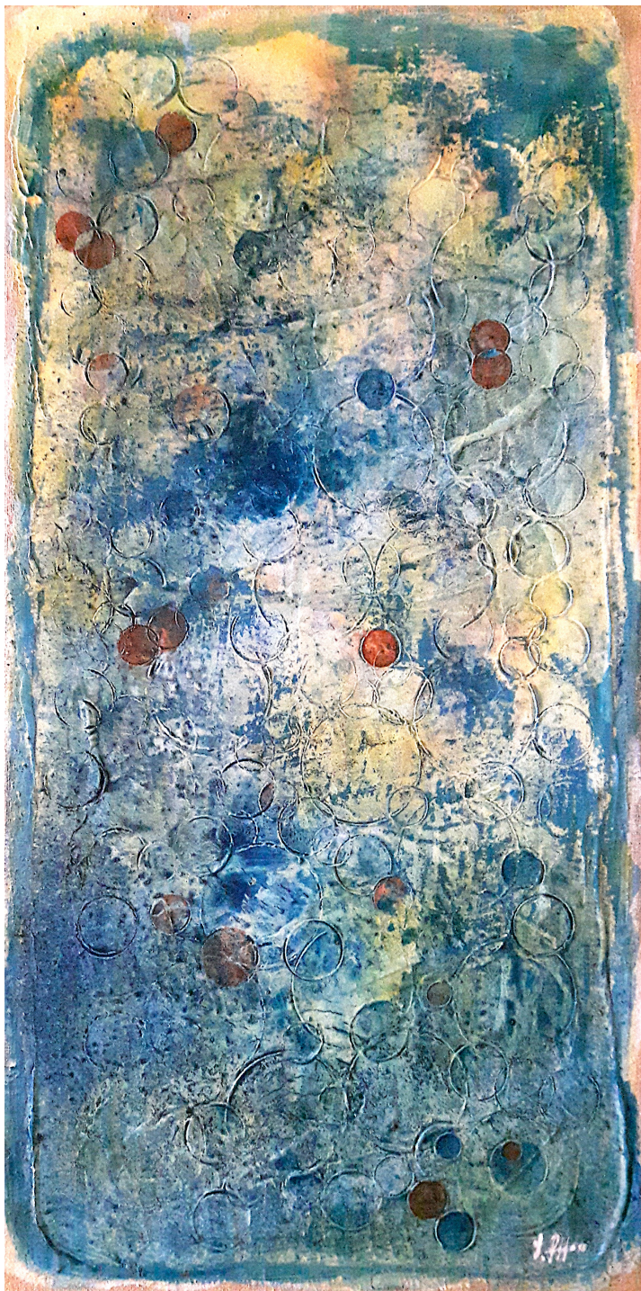
Mondi siderali (2018), tecnica mista su juta, cm 50x100