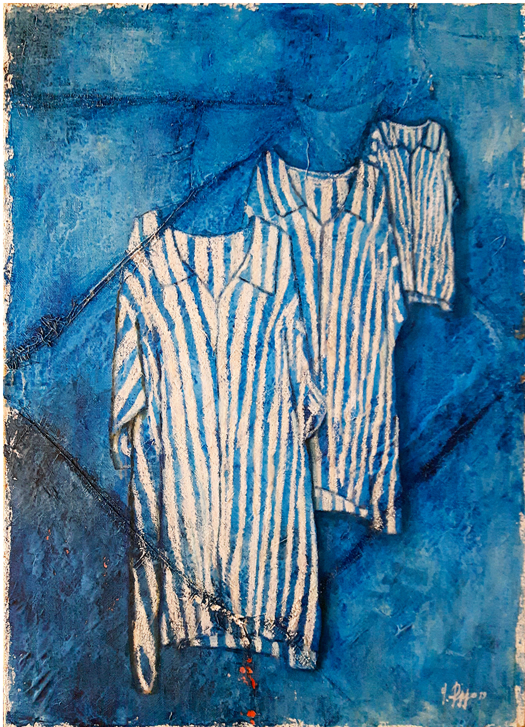
In riga (2019), tecnica mista su tela, cm 65x90