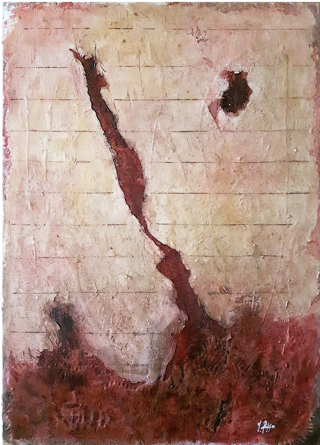
Lacerazioni (2017), tecnica mista su tela, cm 65x90