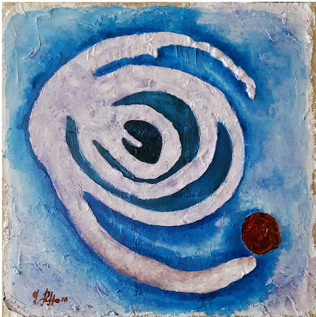
Cariddi (2019), tecnica mista su juta, cm 50x50