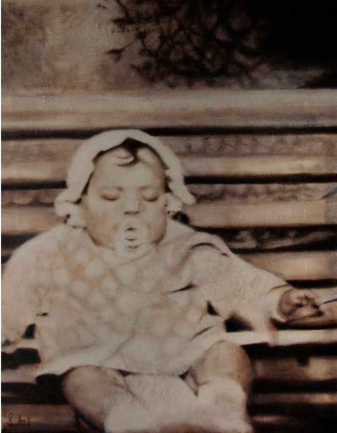
Simone Ari, Ritratto di Adelinda Allegretti (2011), olio su tela, cm 40x50

Nasce a Roma nel 1969 e qui si laurea presso l'Università degli Studi "La Sapienza" in Storia comparata dell'arte dei paesi europei col Prof. Enzo Bilardello, affrontando una tesi di ricerca sul pittore italo-spagnolo Bartolomé Carducho, vissuto in Spagna a cavallo tra il 1500 ed il 1600.