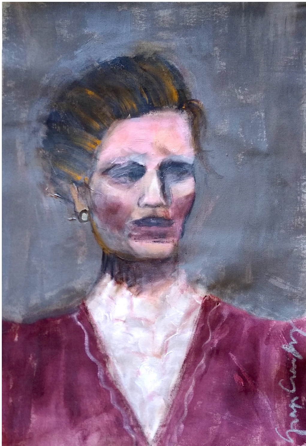
Julia (2019), acrilico su tela, cm 40x60