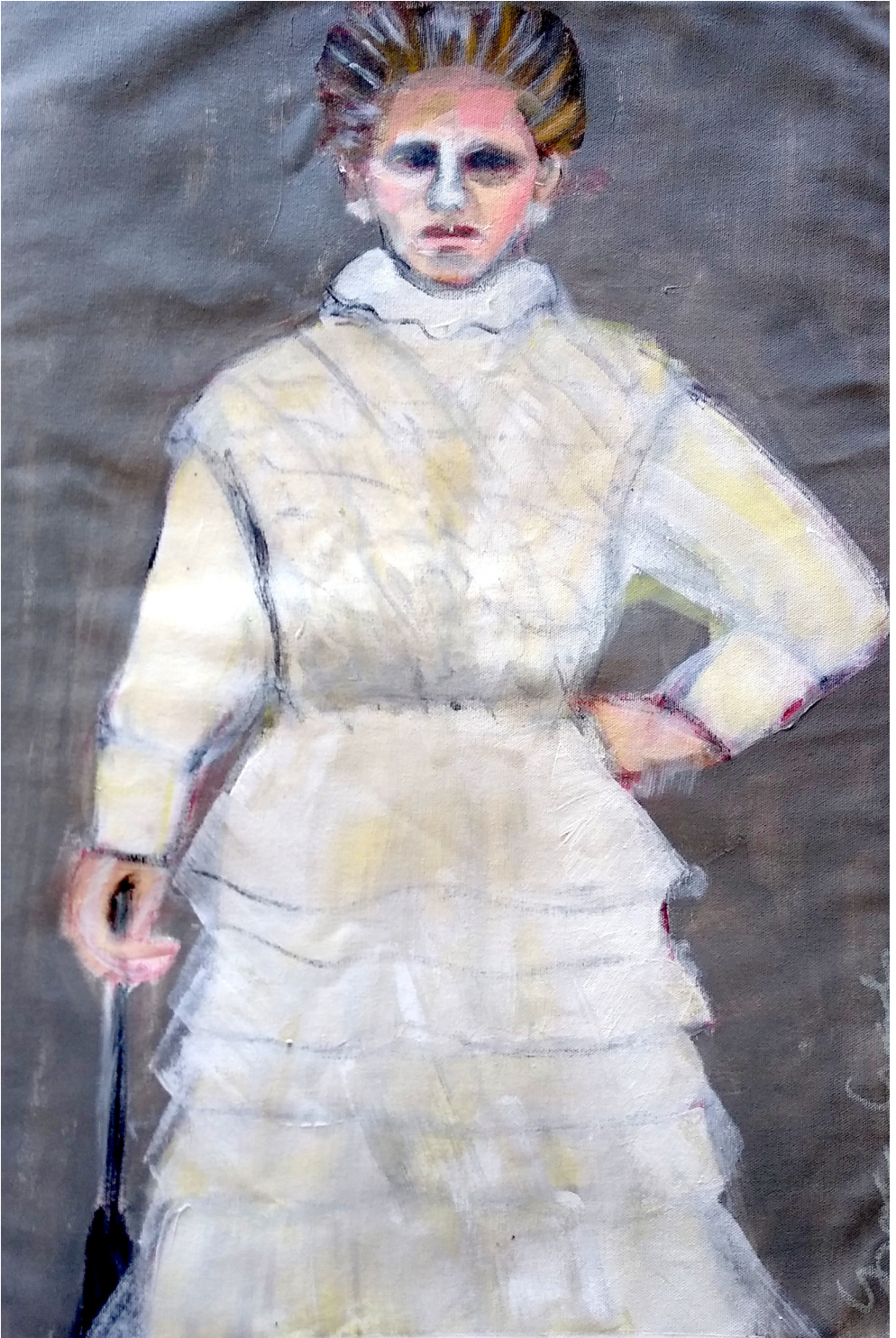
Nina (2019), acrilico su tela, cm 40x60