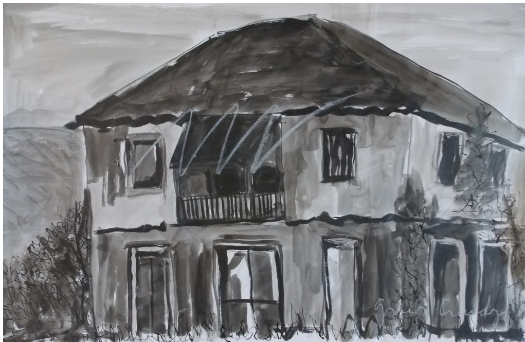
Guardami, Italia! #3 (2019), inchiostro su carta, cm 100x64