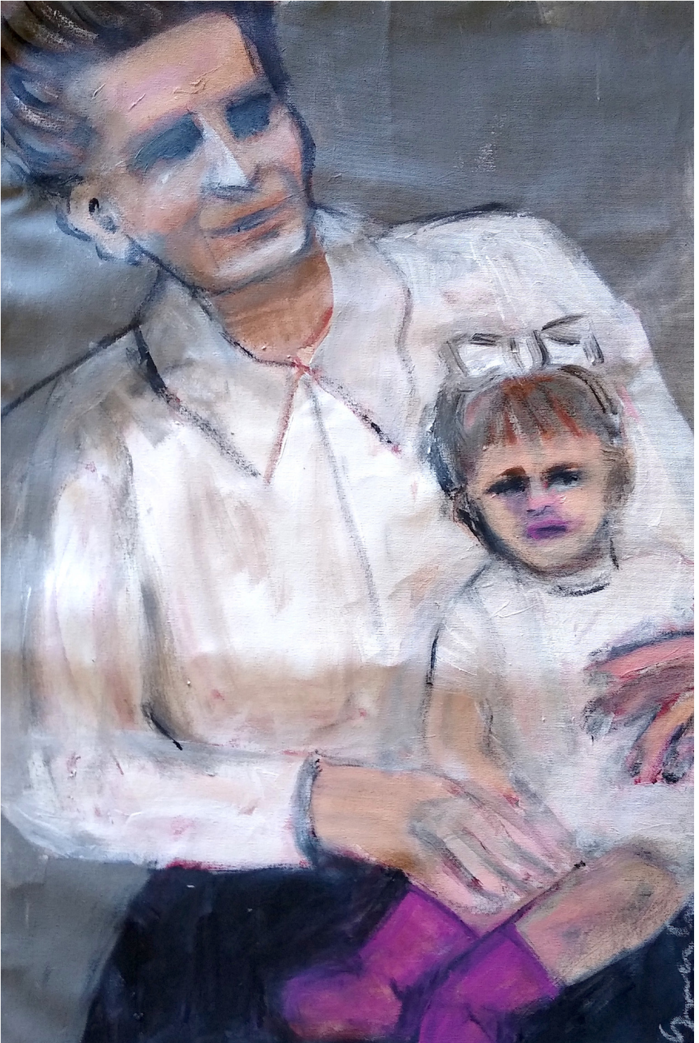
Augusta e Florinda (2019), acrilico su tela, cm 40x60