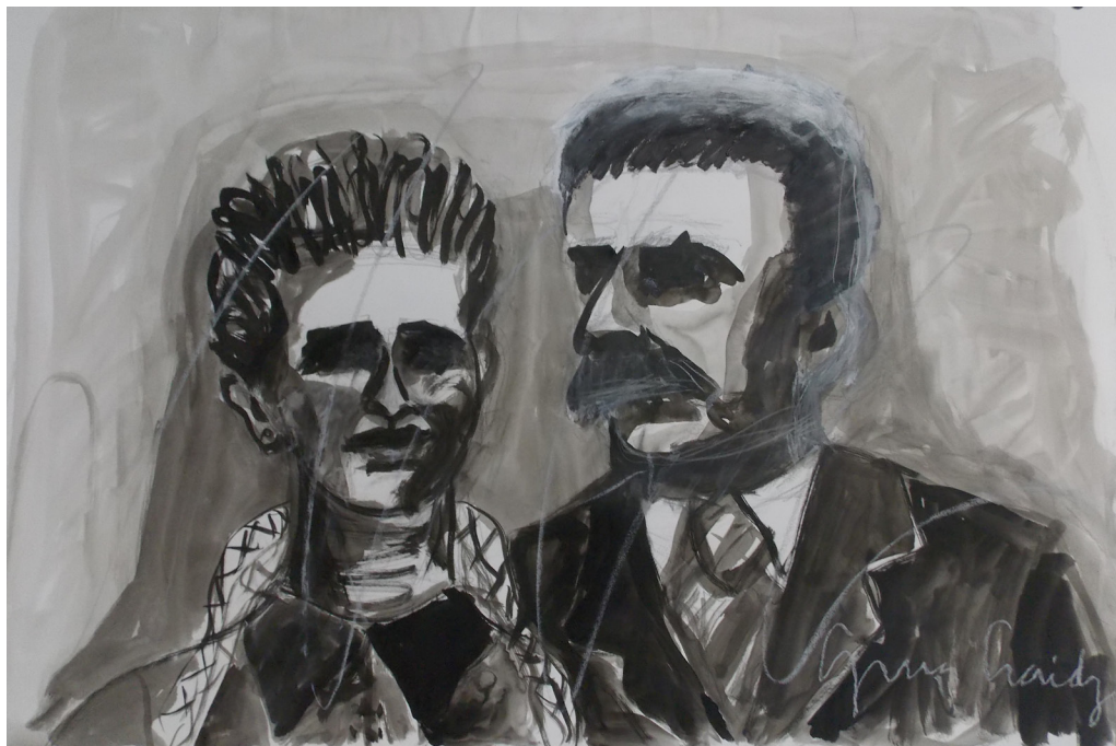
Guardami, Italia! #1 (2019), tecnica mista su carta, cm 100x64,5