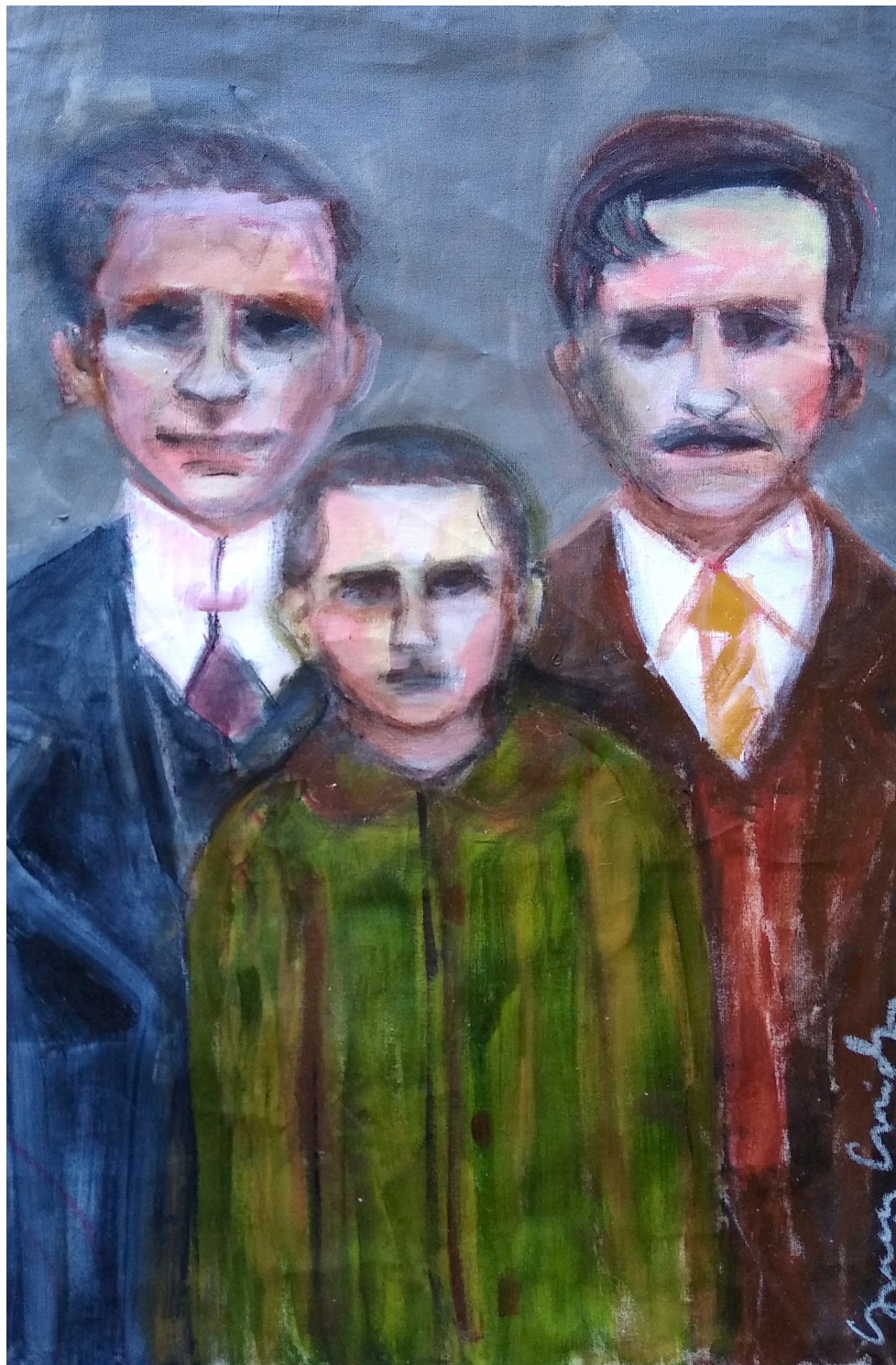
Umberto, Luiz, Giacomo (2019), acrilico su tela, cm 40x60