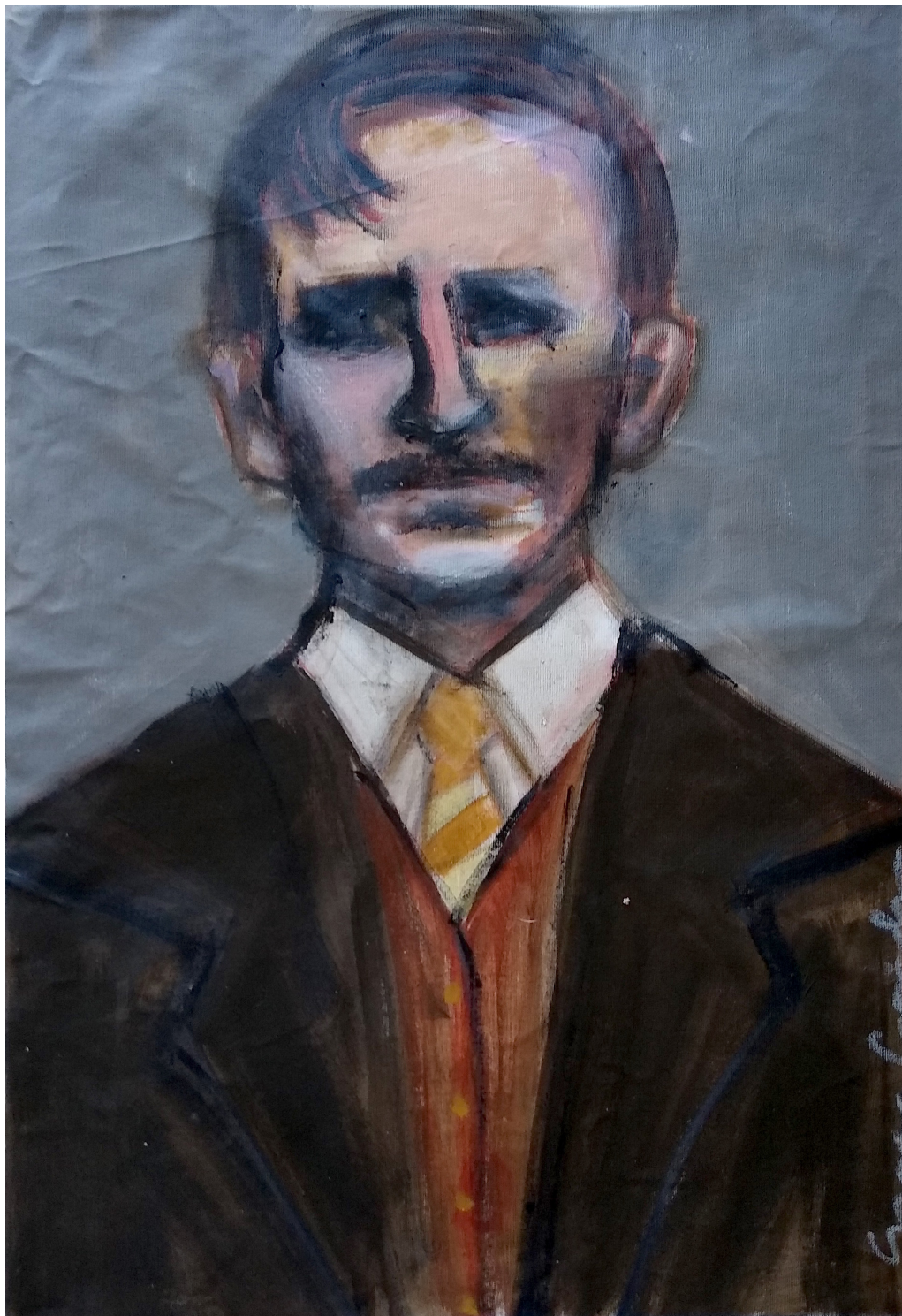
Giacomo (2019), acrilico su tela, cm 40x60