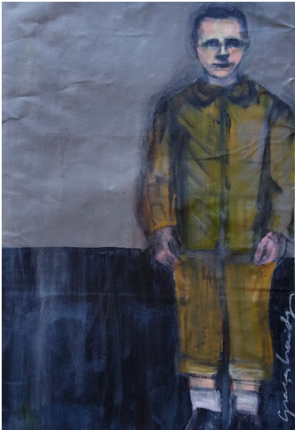
Luiz (2019), acrilico su tela, cm 40x60