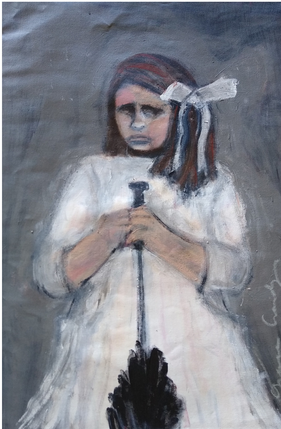
Florinda (2019), acrilico su tela, cm 40x60