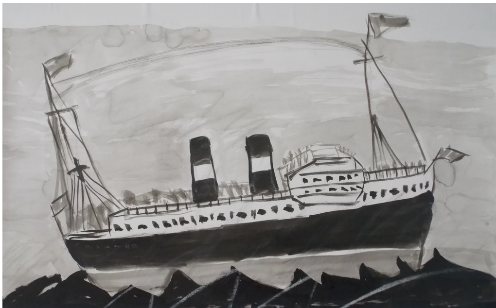
Guardami, Italia! #4 (2019), inchiostro su carta, cm 100x64,5