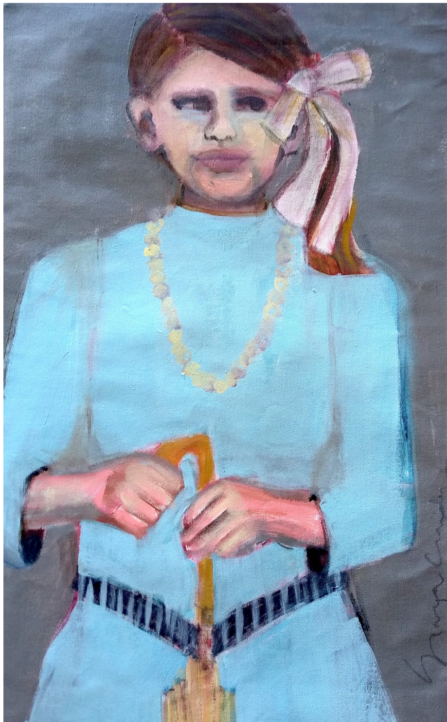
Assunta (2019), acrilico su tela, cm 40x60