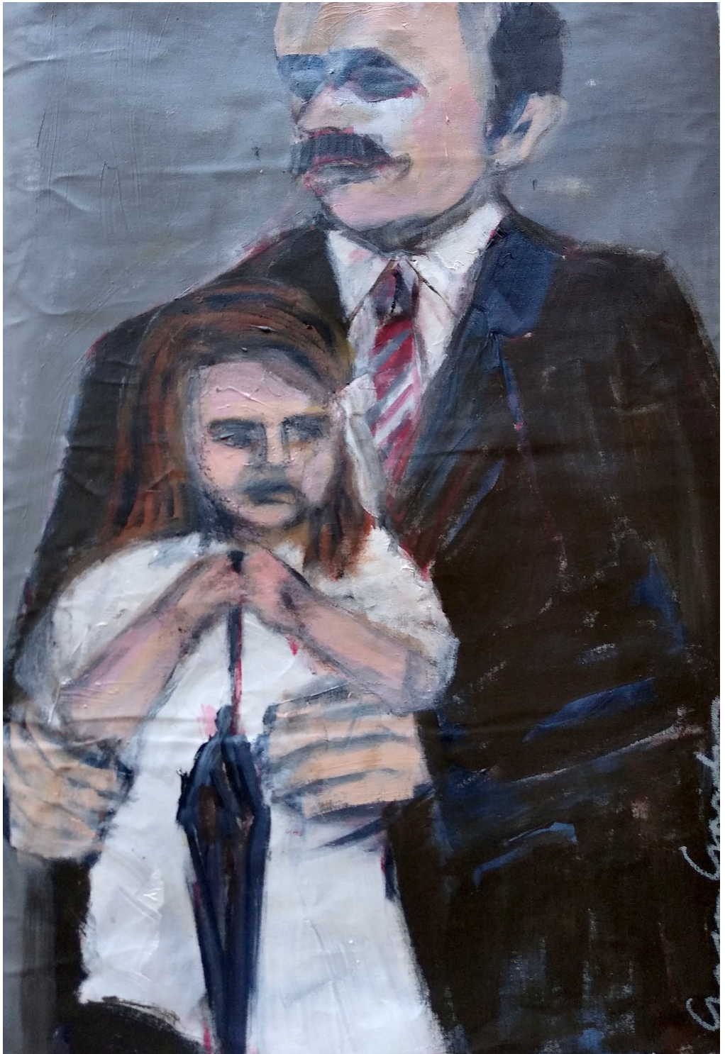
Cassiano e Argia (2019), acrilico su tela, cm 40x60