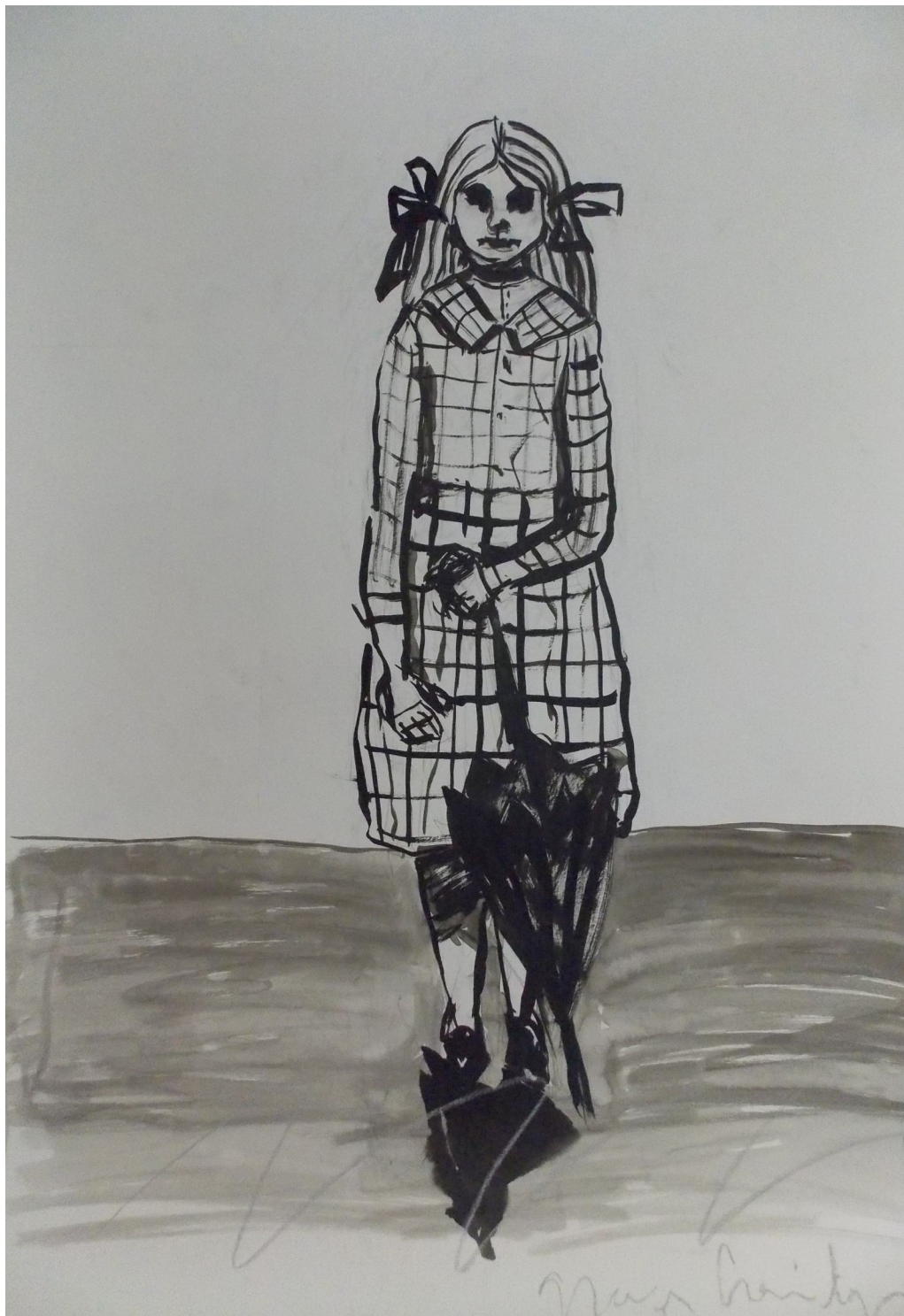
Guardami, Italia! #2 (2019), inchiostro su carta, cm 64x100