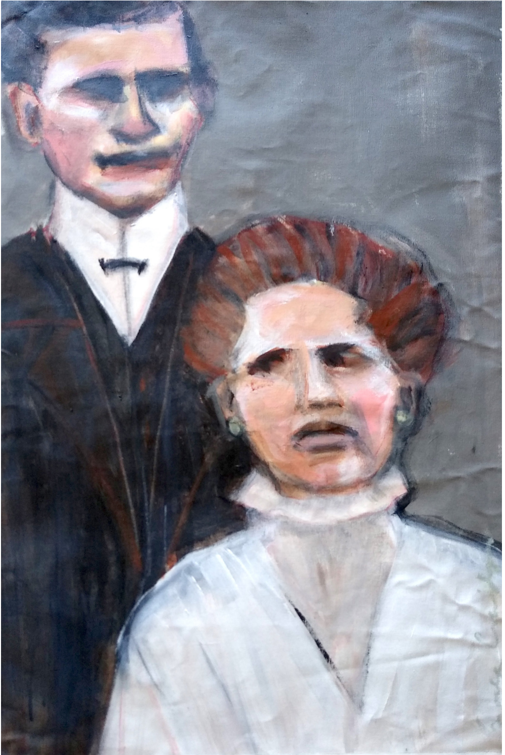
Umberto e Nina (2019), acrilico su tela, cm 40x60