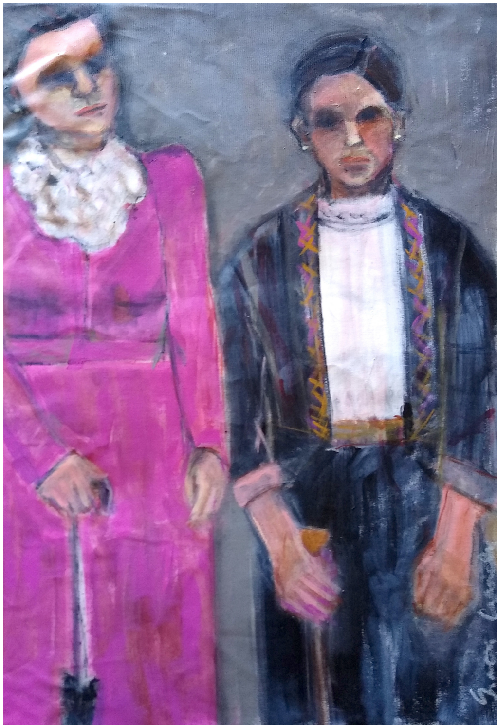
Julia e Santa (2019), acrilico su tela, cm 40x60