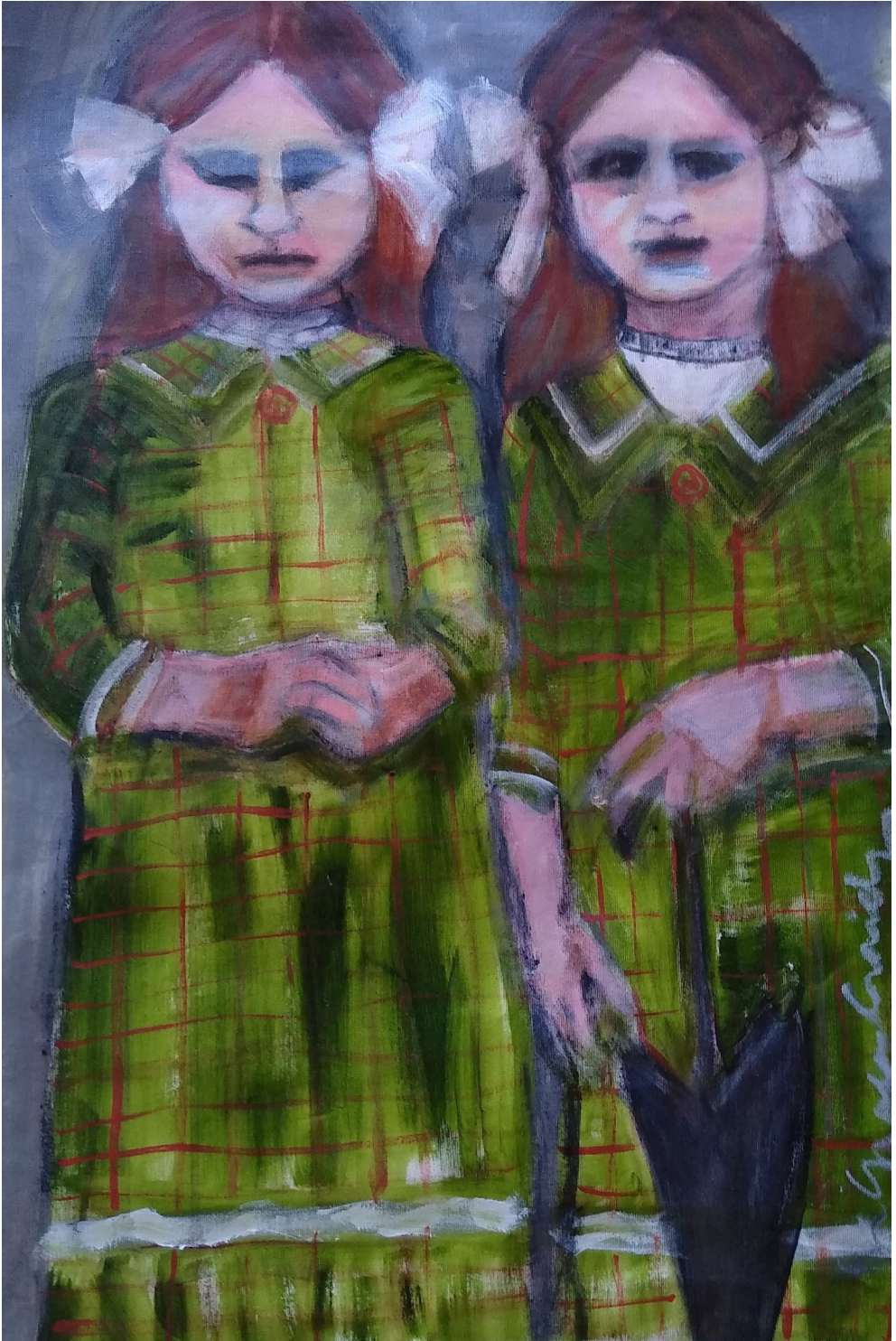
Lucia e Cristina (2019), acrilico su tela, cm 40x60